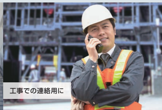
工事での連絡用に