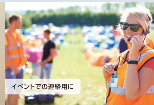
イベントでの連絡用に