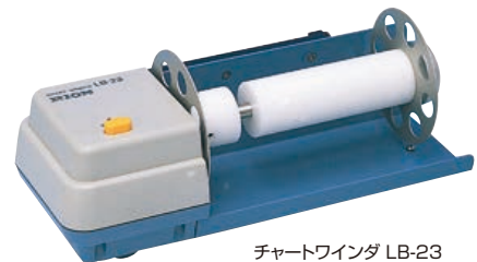
チャートワインダ LB-23

長時間の記録に便利な、記録紙の巻き取り器です。電源は LR-07 より供給されます。