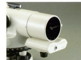
照明装置3型(オプション)

単三乾電池使用の簡単に使える照明装置。望遠鏡の先端に取り付けて、望遠鏡の十字線を照明します。