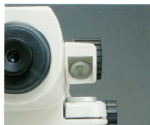
気泡管用ペンタミラー

視準の姿勢を変えずに、ちょっと視線をズラすだけで気泡像が見られる、気泡管用ペンタミラーを採用。像は左右そのままの正立像ですから、まぎらわしさもありません。