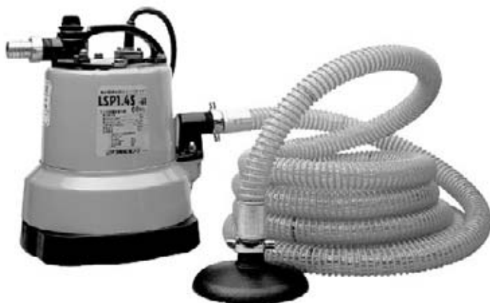
スイバ用アタッチメント