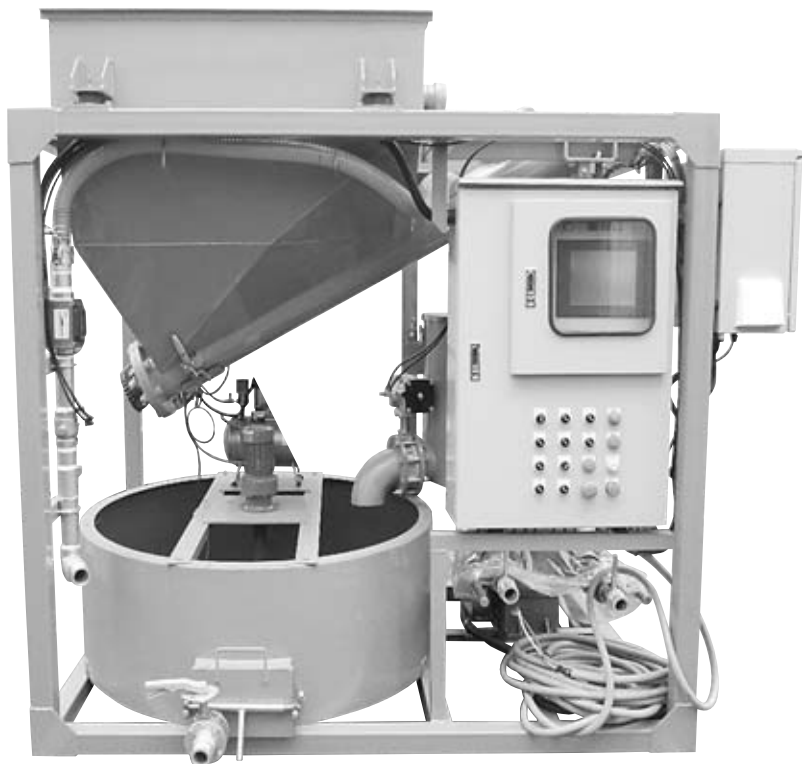
MARTS自社製作プラント