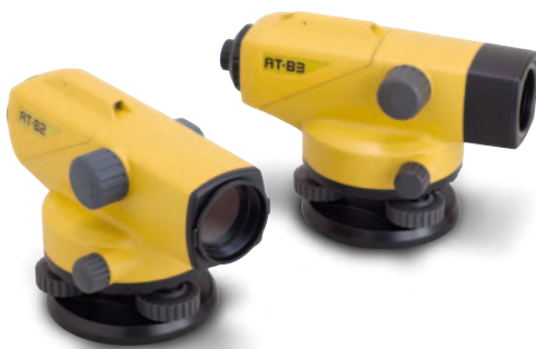
AT-Bseries AUTO LEVEL